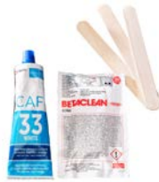
Installationspaket Twusch 301/667