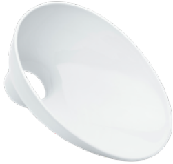
Toiletteinsatz Twusch 301/660