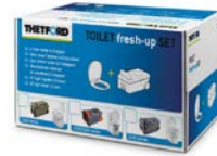
Fresh-Up-Set für C200 Serie 301/954